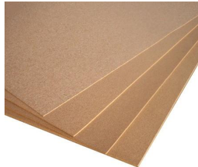
Pavatexplatten 1.7m x 0.65m