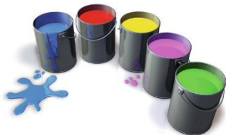
Grundierung, Standardfarben und Farben nach RAL Farbton