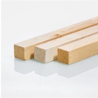
Konterlatten 60mm x 60mm